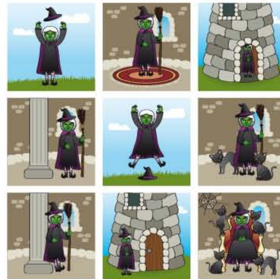
Les repères spatiaux - Niveau 2 - La sorcière

Quand un joueur a sa planche complète, il gagne la partie.